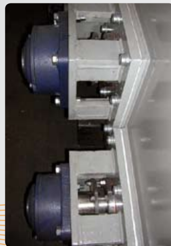
Supporti con cuscinetti Seal and bearing