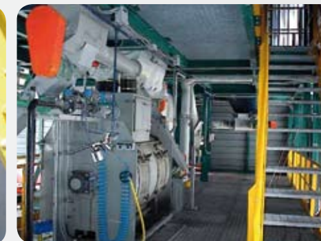
Polveri e liquidi Powders and liquids