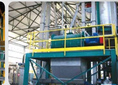
A scarico totale Total discharge