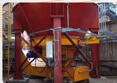
Fanghi da silo 120 mc Sludge