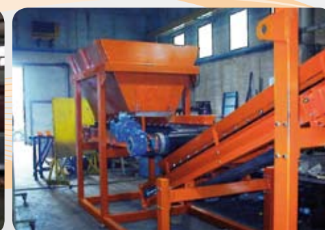
A nastro / Belt