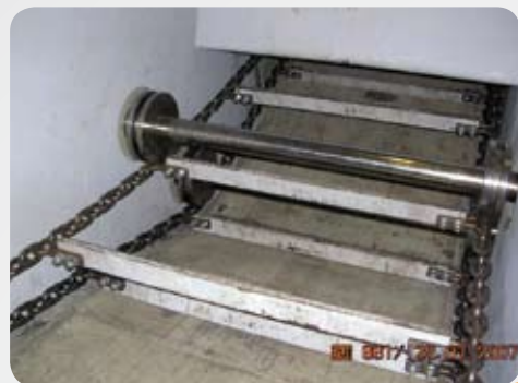
Catene e raschiatori Chain and scraper