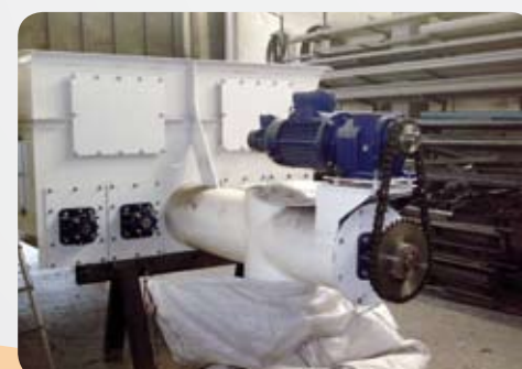
Multi coclea / Five Screw