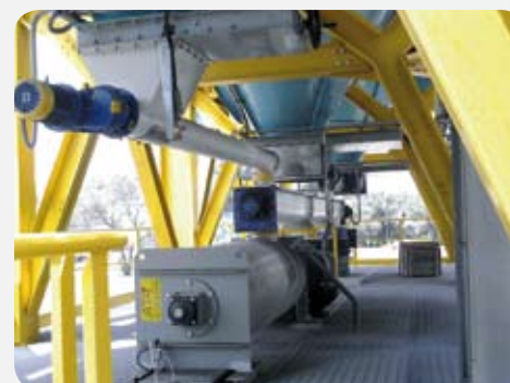
Inertizzazione Chemical fixing