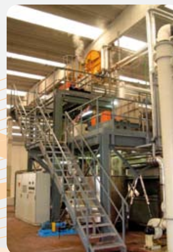
Processi chimici Chemical processes