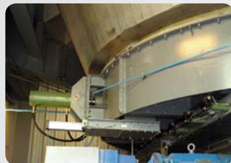
Azionamento idraulico Hydraulic piston