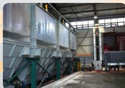
Pesate / Weighted