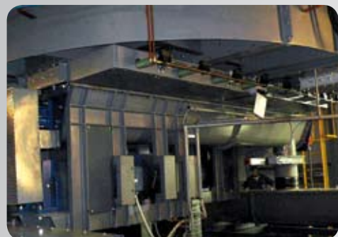
Ceneri Ø 5,4 mt da silo 800 mc Fly ash