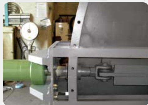
Azionamento idraulico Hydraulic piston