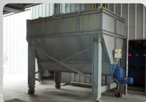
Con coclea / Screw conveyor