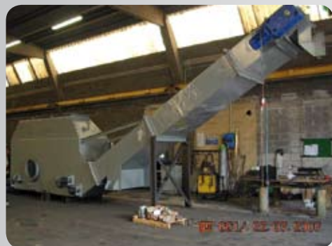
Estrattore Chain conveyor